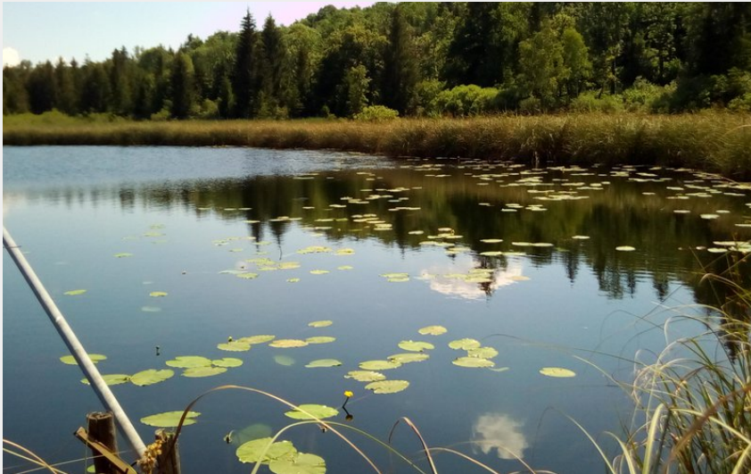
Lac Onoz (Mairie Onoz)