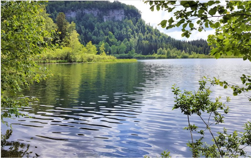
Lac de Bonlieu