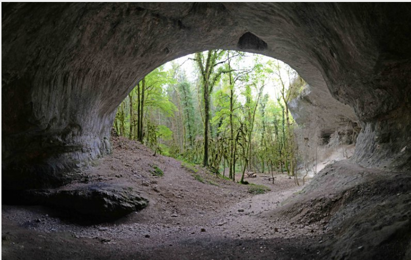
La Caborne du Boeuf