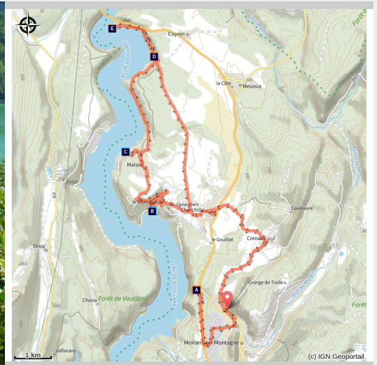
Lac de Vouglans (Clara BURTIN)

Des eaux turquoise du lac aux forêts et belvédères.