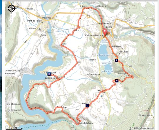
Lac de Clairvaux (OT Clairvaux-les-Lacs)

De Clairvaux à Vouglans, le calme des lacs et forêts