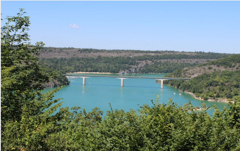
Belvédère Château Richard