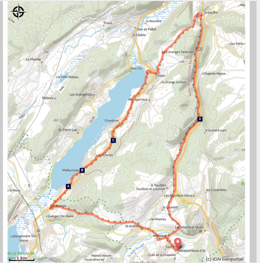
Lac de Saint-Point (Daniel Bouthiaux)

entre paysages, sources mystérieuses et rives du lac