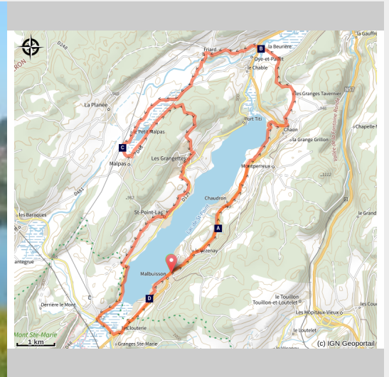
Lac de Saint-Point (Daniel Bouthiaux)

Du grand lac de Saint-Point au trésor méconnu de Malpas