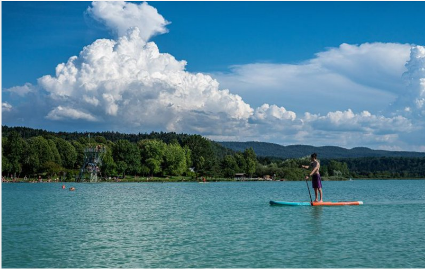
Lac de Clairvaux (OT Clairvaux-les-Lacs)