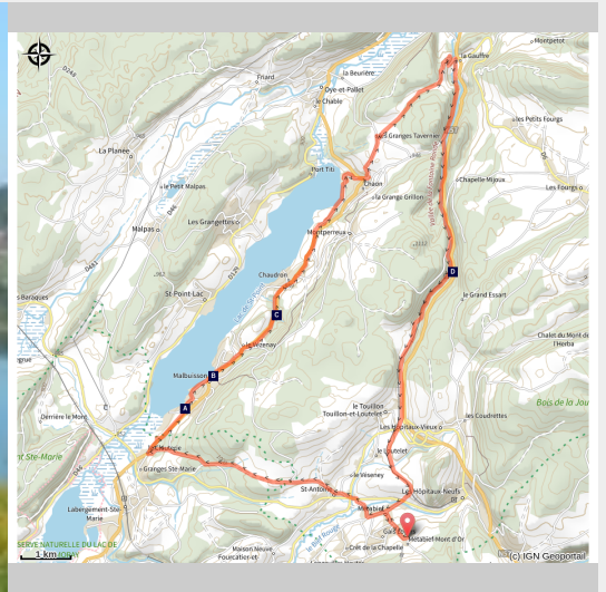
Lac de Saint-Point (Daniel Bouthiaux)

entre paysages, sources mystérieuses et rives du lac