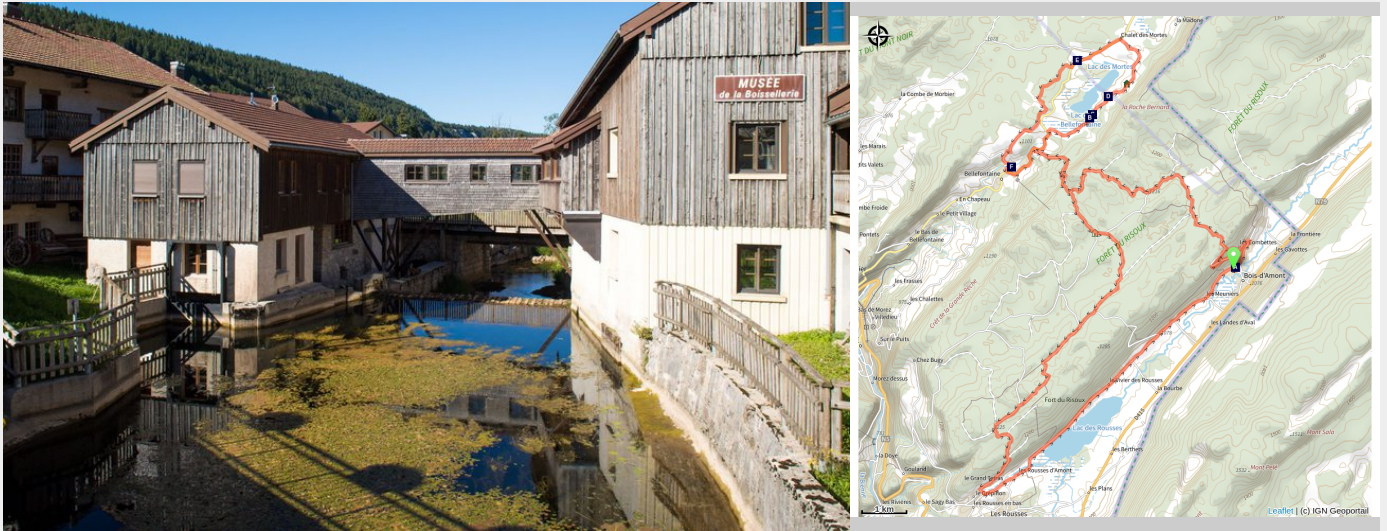
Musée de la Boissellerie (Benjamin Becker)