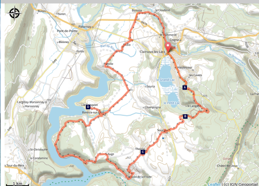
Lac de Clairvaux (OT Clairvaux-les-Lacs)

De Clairvaux à Vouglans, le calme des lacs et forêts