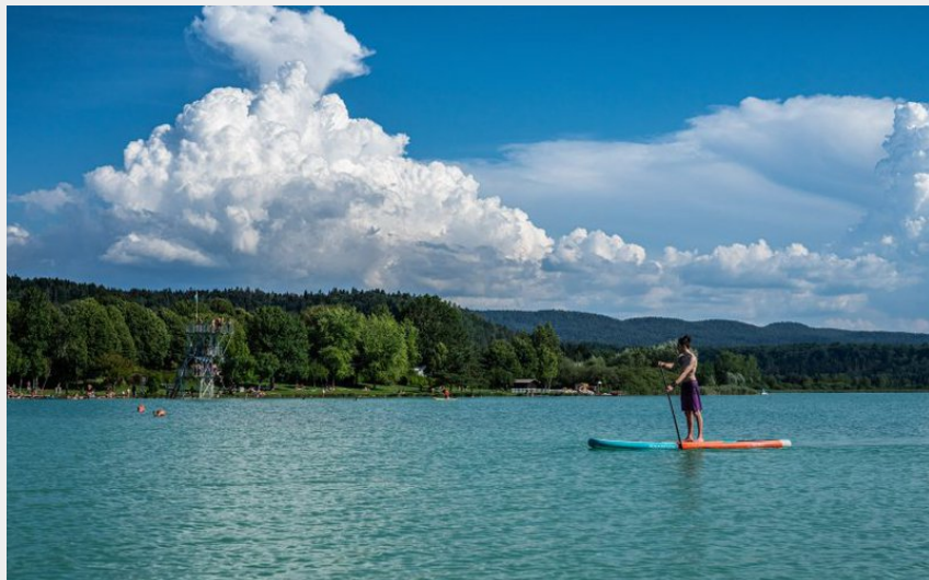
Lac de Clairvaux (OT Clairvaux-les-Lacs)