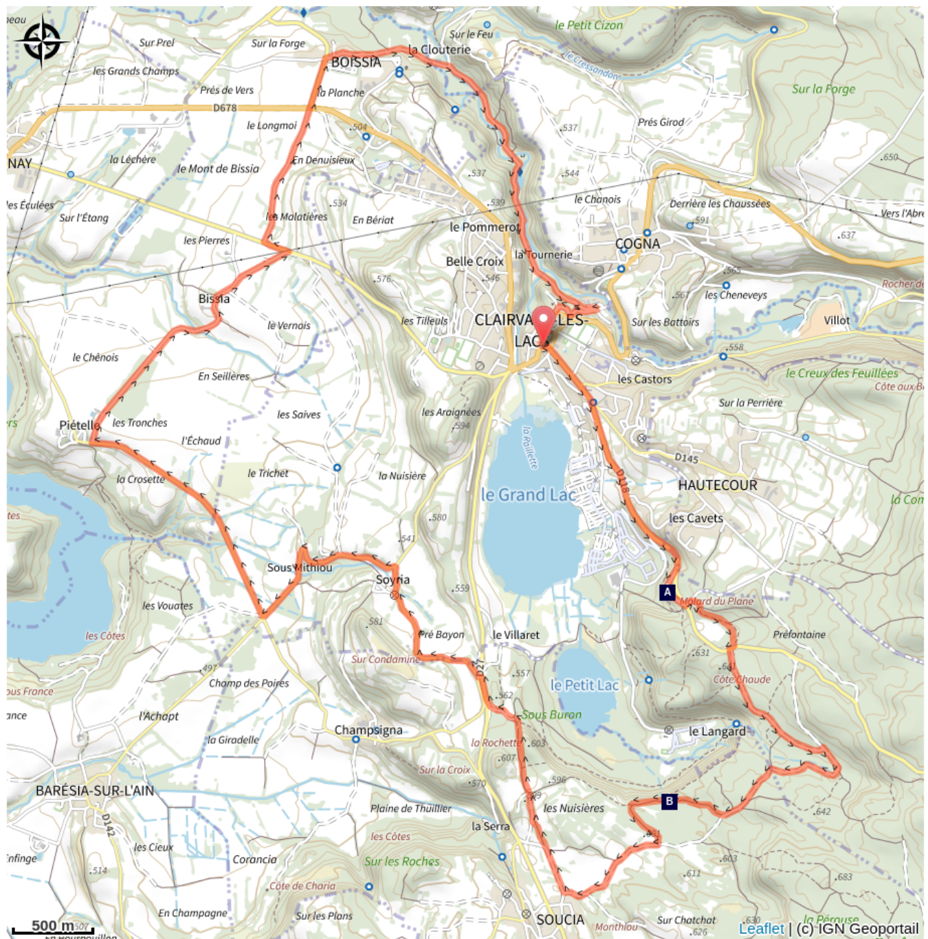
Belvédère du Grand lac (A)