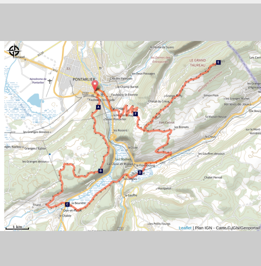
Belvédère des Granges (CCGP)

De la forêt du Laveron au sommet du Larmont