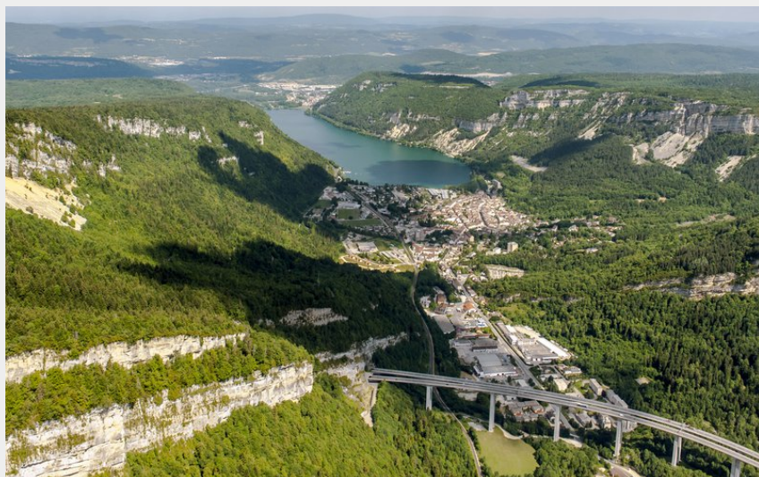
Cluse de Nantua (Marc Chatelain)