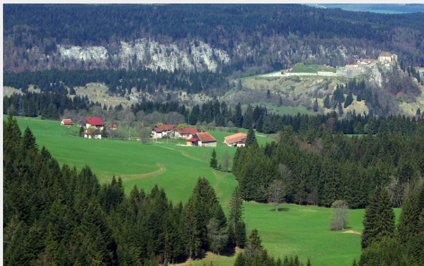
Belvédère de la Roche Sarrazine (Paul Verniau)