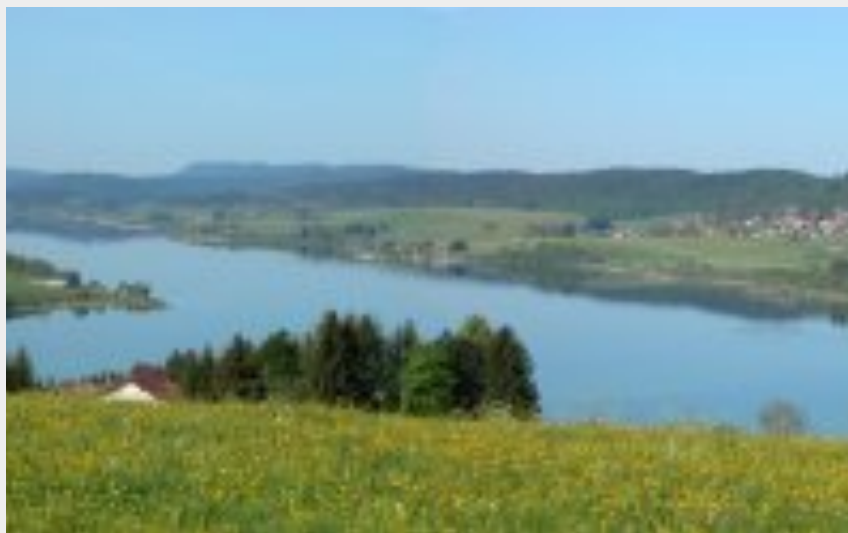
Lac de Saint-Point (Daniel Bouthiaux)