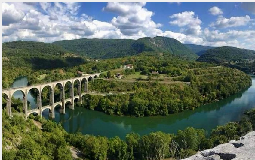
viaduc de Cize