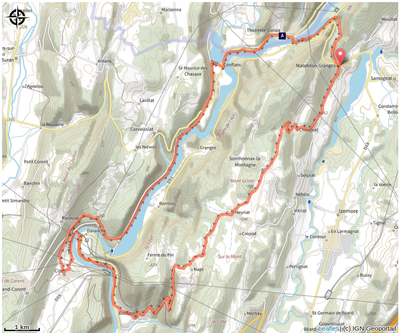
La Lône (A)