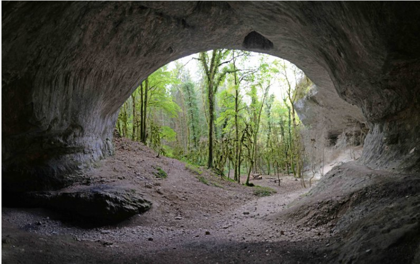
La Caborne du Boeuf