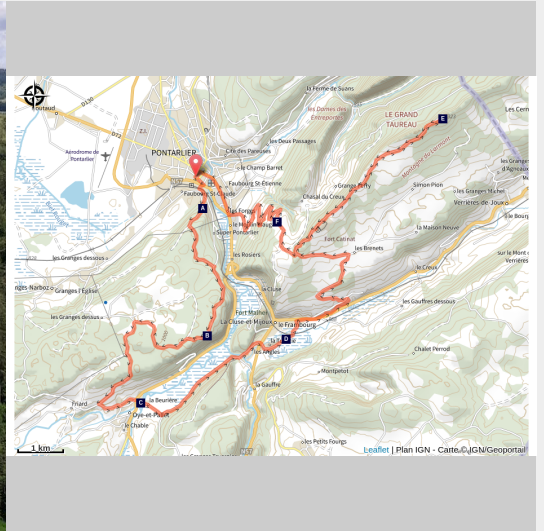
Belvédère des Granges (CCGP)

De la forêt du Laveron au sommet du Larmont