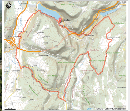
Cluse de Nantua (Marc Chatelain)

Ses lacs, étangs et sources, entre nature et histoire.