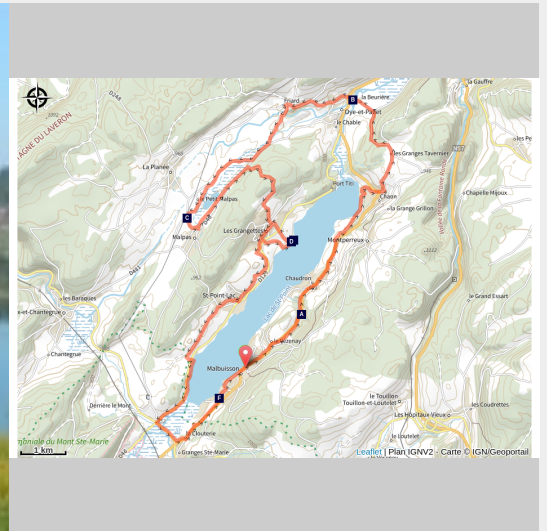
Lac de Saint-Point (Daniel Bouthiaux)

Du grand lac de Saint-Point au trésor méconnu de Malpas