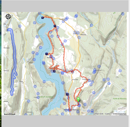
Lac de Vouglans (Clara BURTIN)

Des eaux turquoise du lac aux forêts et belvédères.