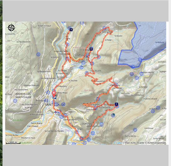
Cascade de la Queue de Cheval - Saint-Claude

Un écrin de verdure dans la fraîcheur des cascades du Haut-Jura