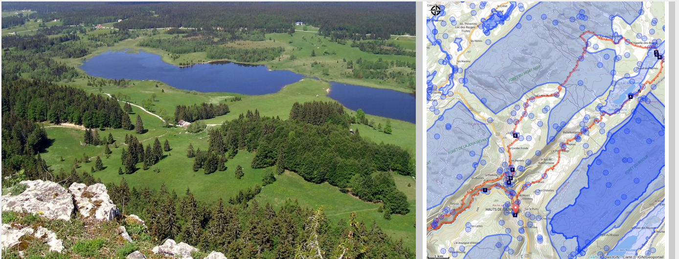
Vue sur les lacs depuis la Roche Bernard (J. Carrot)

Un écrin de verdure, entre plateau et gorges de la Bienne